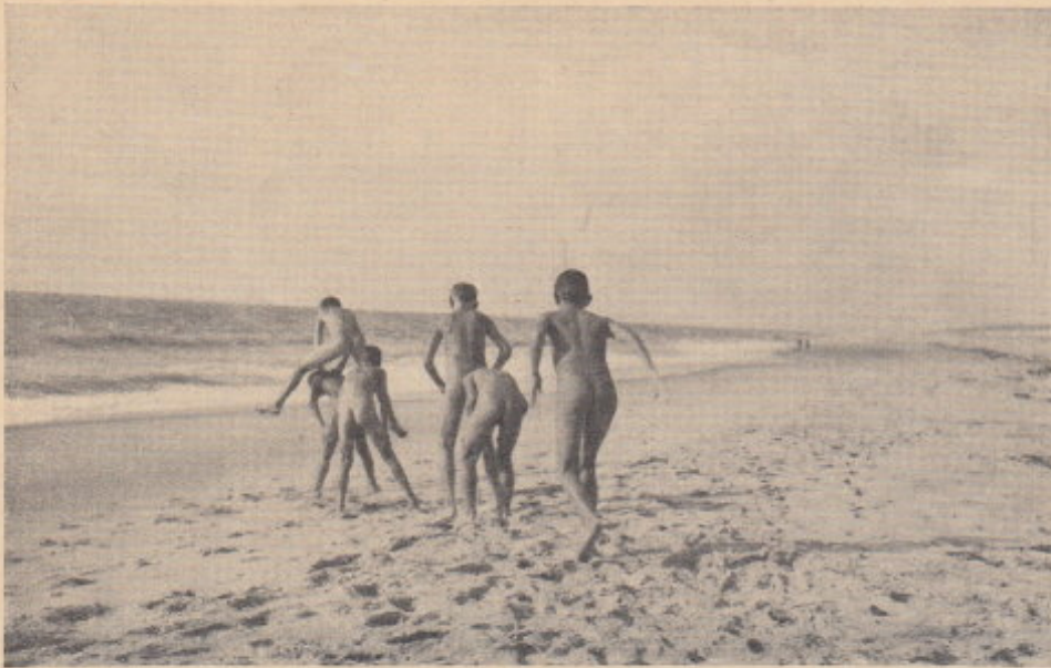
Bockspringen seewärts.