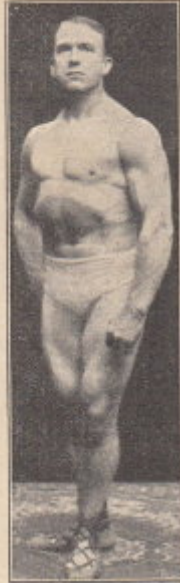
Strongfort, das Ideal männlicher Vollkommenheit

hat tausende von Schwächlingen zu wirklichen Männern gemacht. Sie wird auch Ihnen helfen. Ohne Medizin und ohne Apparate, allein durch die erweckten Kräfte der Natur werden Sie Ihre Mängel, Schwächen und Beschwerden, die Folgen jugendlicher Fehler, überwinden. Sie werden widerstandsfähige Gesundheit, imponierende männliche Kraft, Leistungsfähigkeit und Ausdauer erlangen. Strongfort's interessantes, reich illustriertes