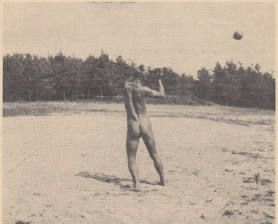
Kräftige Durcharbeitung des Oberkörpers Aufnahme BfFK Üdersee